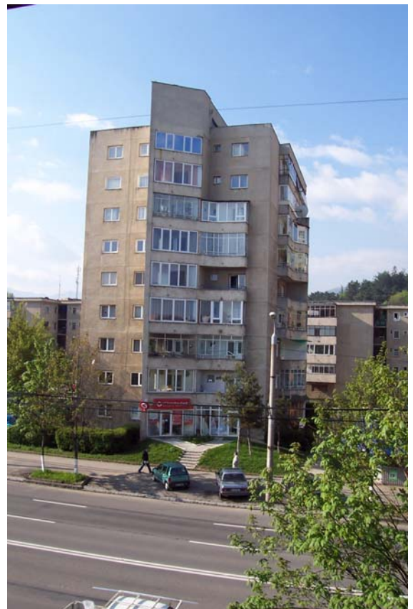
Blick aus meinem Apartment auf einen typischen Wohnblock in Brasov.