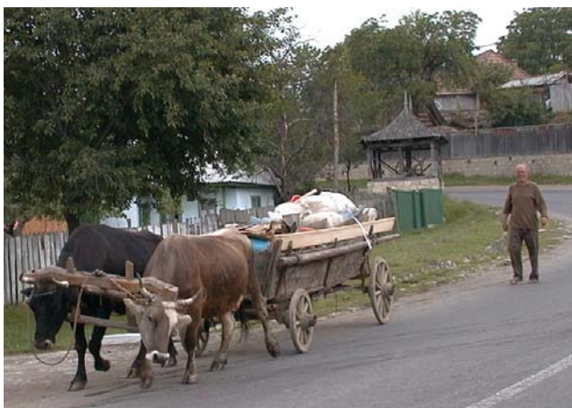
Ursprünglichkeit: Bauer mit Ochsengespann. Üblich sind jedoch Pferdefuhrwerke (auf dem Dorf).

Zudem ist es von den ehemaligen Ostblockländern in halbwegs vernünftigen Zeiten mit dem Auto zu erreichen. Die Fahrt von Regensburg dauert rund 9 Stunden bis zur Grenze in Nadlac.