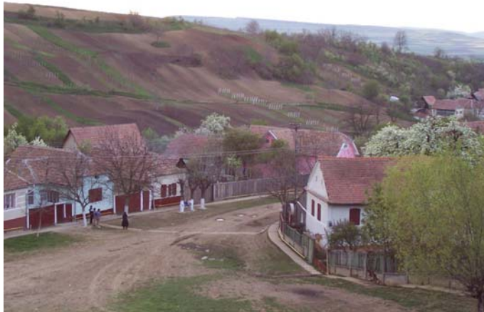
Dorf im Jidvei. „Unser“ Bauernhaus liegt 2 Häuser weiter, als das rechts sichtbare.