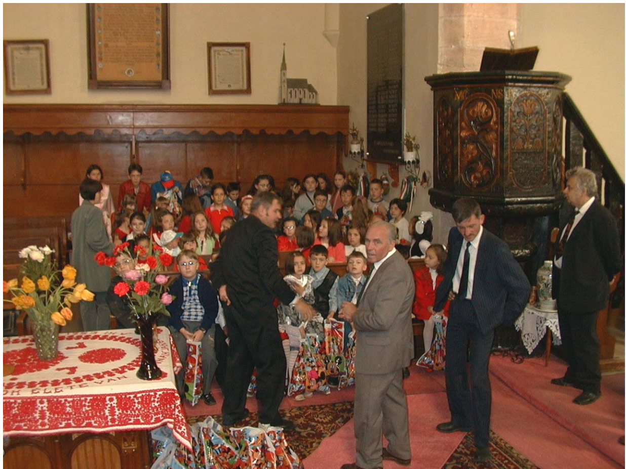
Verteilung der Spenden in der Kirche in Dej, der Pfarrer in schwarz, etwa in der Mitte des Bildes mit dem Rücken zur Kamera. Die Kinder sitzen nach Schuljahren, die Lehrerin (links) hat für jedes Kind eine Tüte gepackt

Unter'm Strich ließ ich meine Sachen dann bei besagtem Pfarrer, der Sie unter den Kindern seiner Kirchengemeinde verteilte.