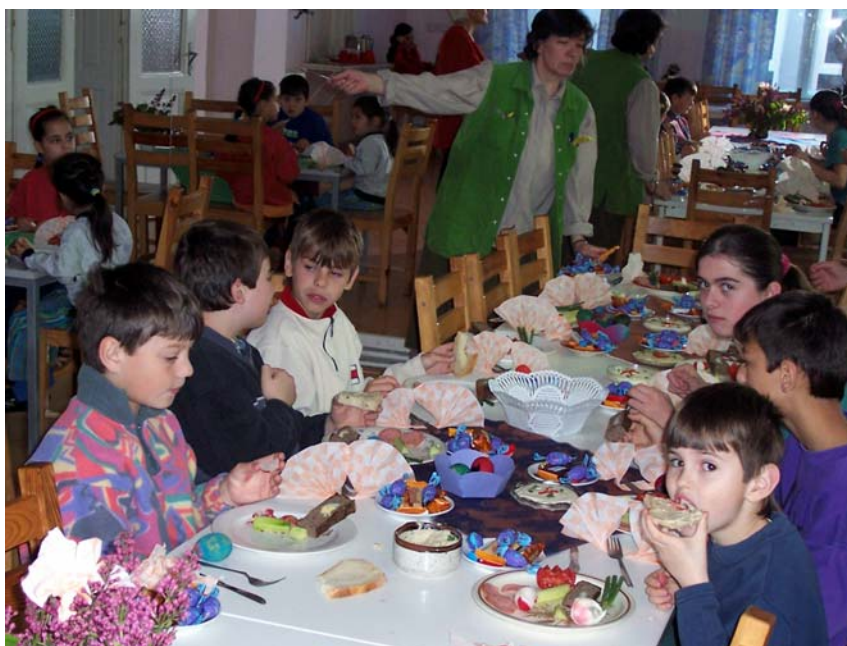
Speisesaal zu Ostern (orthodox). Der Wandspiegel im Hintergrund wurde für das Tanztraining angebracht (später mehr).

Umfahren der Schlaglöcher. Auf dem Dorf sind die Straßen, abgesehen von der Hauptdurchgangsstraße, in der Regel ungeteert. Der Wunsch zum Abschied „Drum bun!“, vergleichbar mit unserem „Gute Fahrt!“ heißt eigentlich wörtlich „Straße gut“, ein Wunsch, der auf den meisten rumänischen Straßen ungehört verhallt. Die Schlaglöcher sind zum Teil so groß und tief, dass man, einmal hineingeraten, sich durchaus darin verfahren kann. ;-)