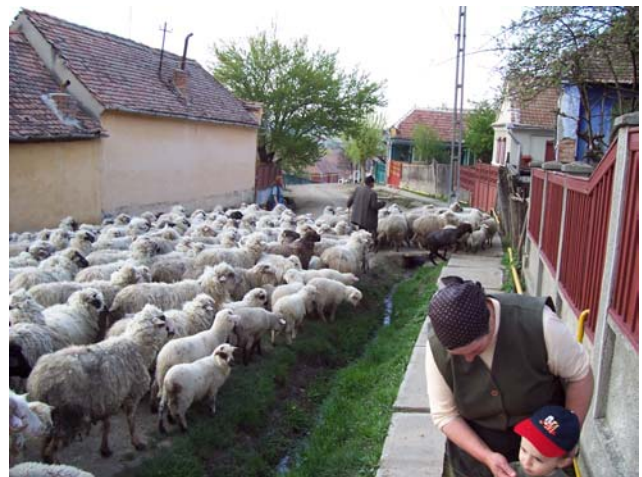
Der Schäfer bringt die Schafe heim zu den Gehöften.

Als wir uns wieder verabschieden, macht mir der Bauer klar, dass man mich am Ostersonntag wieder zum Essen erwarte. Man habe irgend ein Tier geschlachtet (vermutlich ein Schaf), er wolle anspannen und mit mir im Fuhrwerk durch das ganze Dorf fahren. Vermutlich war ich seit Jahren der erste Tourist im Dorf. Da ich angereist bin, um das Heim und die Kinder kennen zu lernen, habe ich die Einladung nicht wahrnehmen können. Ich befürchte, dass ich es mir mit ihm verscherzt habe.