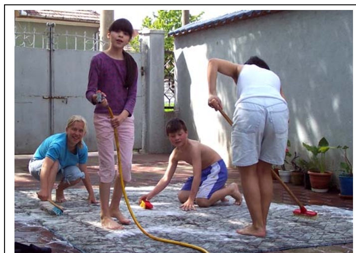
Sonntag Nachmittag wurde der Teppich aus den Club gereinigt, mit viel Wasser und Schaum.

Nachmittags gehe ich mit einigen Kids zum Fußballspielen. Wir gehen zu einem nahegelegenen Schulzentrum mit 3 oder 4 Plätzen aus Beton. Fußball ist eine übliche Beschäftigung in Rumänien am Sonntag Nachmittag. Auf einem der Plätze spielen auch Erwachsene. Sandel geht im