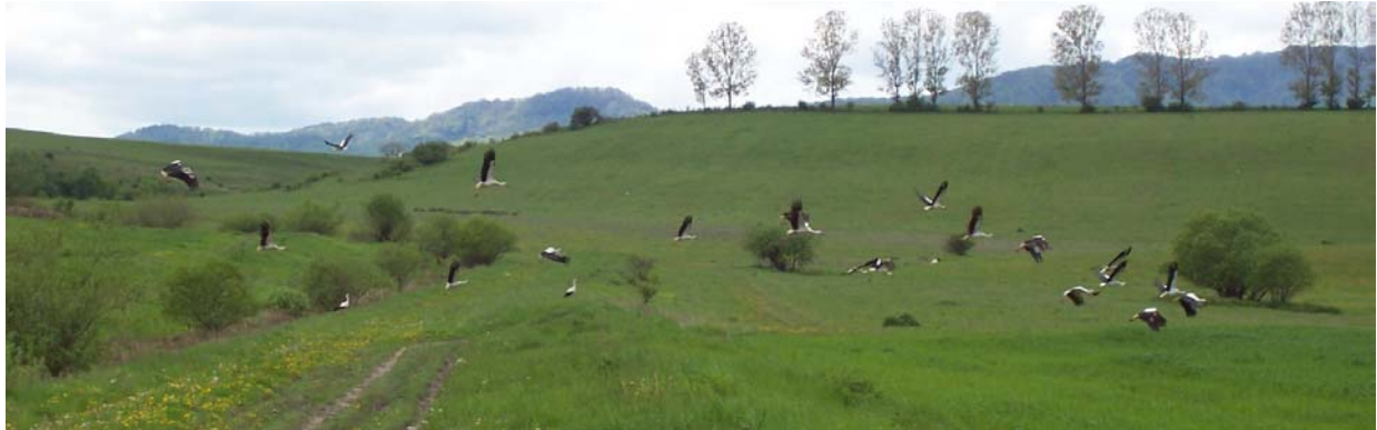
Außerhalb von Brasov sah ich eine Gruppe Störche, in zwei etwa gleich große Teilgruppen aufgespalten. Leider kam ich nicht nahe genug heran. Diese Teilgruppe mit 21 Tieren flüchtet gerade vor mir.

In vielen Teilen Rumäniens ist die Welt noch in Ordnung. So leben hier noch Wölfe und Bären (in Brasov sollen sie bis in die Stadt kommen), Luchse und Auerhähne. Und jedes Dorf, das etwas auf sich hält, verfügt über mindestens ein Storchennest.