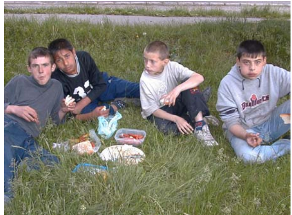
Picknick mit Straßenkindern in Brasov

Rumänien ist ein landschaftlich sehr reizvolles Land. Aufgrund der guten Erfahrungen vom Vorjahr habe ich mich dann entschlossen, dem Land einen zweiten Besuch abzustatten. Auf die Mitnahme von Spenden habe ich aufgrund der Informationen aus 2003 verzichtet. In diesem Jahr habe ich dann auch endlich in Brasov „meine“ Straßenkinder gefunden. Leider habe ich sie 2005 nicht wieder getroffen.